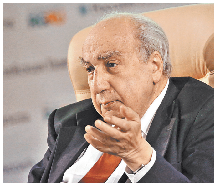
Александр Чубарьян: Стандарт — не вердикт.

АЛЕКСАНДР ЧУБАРЬЯН: Я думал, что споры на эту тему давно закончены. Ан нет. Но историки знают: пришедшие на территорию нынешней России варяги во главе с Рюриком ассимилировались с местным населением, которое достигло к тому времени уже определенного уровня экономики и культуры. Государство сформировалось на основе этой ассимиляции. Недаром Рюрик назвал его Русью, а не Скандинавией. Мы обязательно